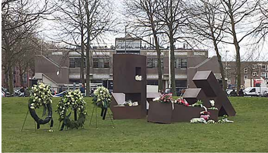
Herdenkingsmonument het Vergeten Bombardement